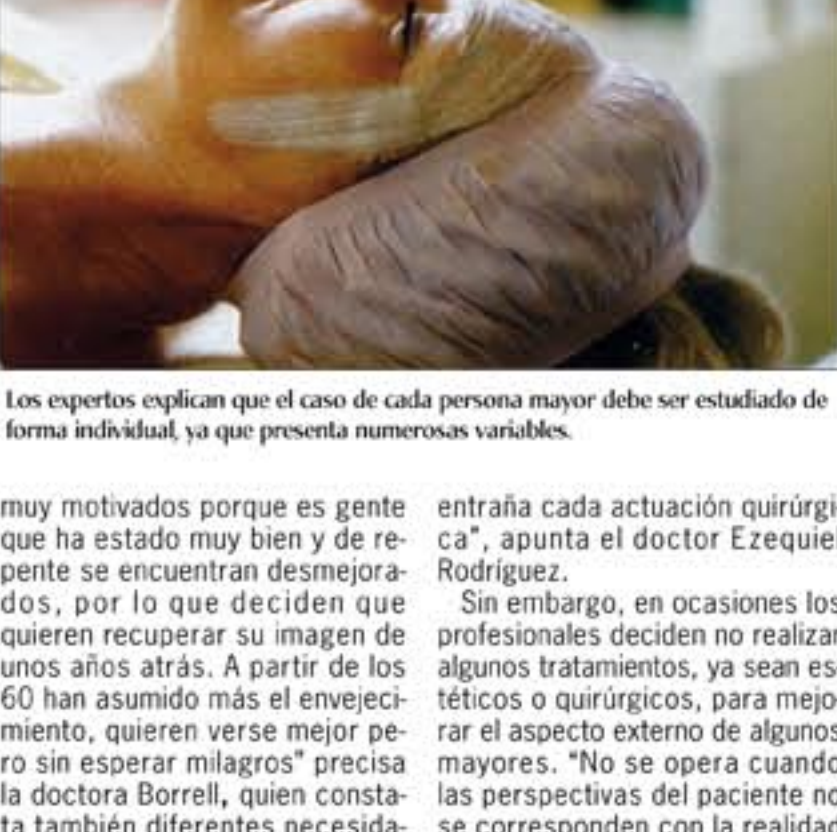
Los expertos explican que el caso de cada persona mayor debe ser estudiado de forma individual, ya que presenta numerosas variables.

En la actualidad casi toda la población puede acceder a la medicina estética. Hay un gran abanico de técnicas y tratamientos que se realizan sin necesidad de hospitalización y con unos mínimos cuidados de postratamientos que abaratan los costes y la hacen muy asequible.