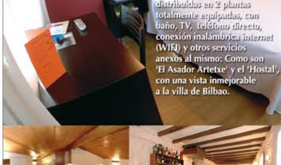
Cuenta con 12 habitaciones distribuidas en 2 plantas totalmente equipadas, con baño, TV, teléfono directo, conexión inalámbrica internet (WIFI) y otros servicios anexos al mismo: Como son 'El Asador Artetxe' y el 'Hostal', con una vista inmejorable a la villa de Bilbao.