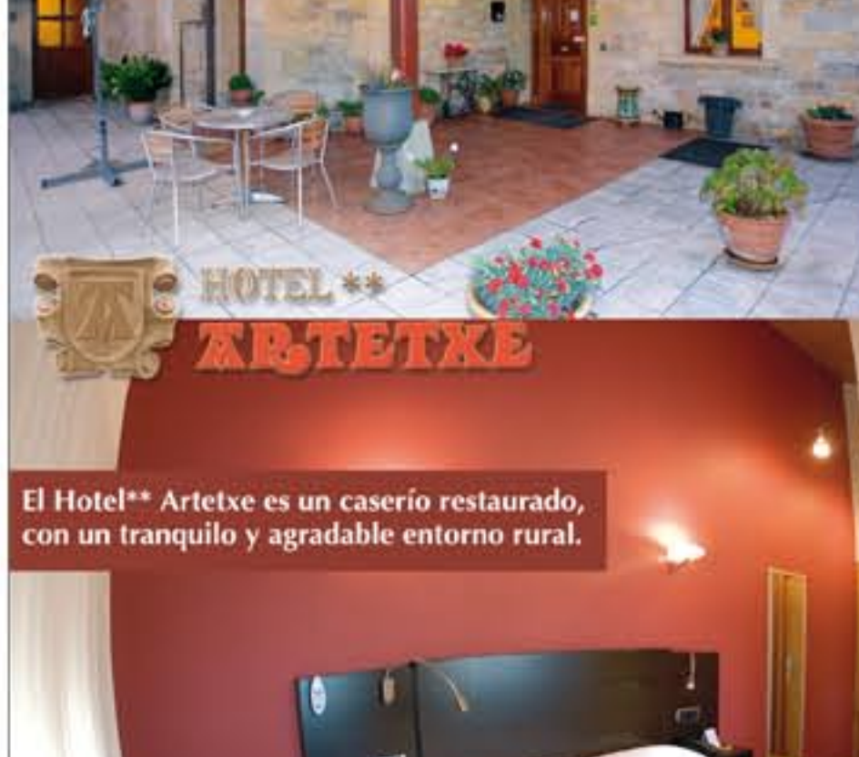
El Hotel** Artetxe es un caserío restaurado, con un tranquilo y agradable entorno rural.

Otras razones, menos subjetivas son los físicos. Sin duda, como explica el doctor Rodríguez, "un bloqueo de rama o una diabetes que puede producir un retardo en la cicatrización" son motivos para descartar una operación estética. Aunque también se deben comentar con el paciente y su familia otros problemas físicos o dolencias consideradas "menores" para que conozcan sus posibles consecuencias explica el doctor Ezequiel Rodríguez. El presidente de la Secpre puntualiza, además, que cuando se hace la exploración, se explica la intervención al interesado y sus posibles complicaciones, entonces "muchas gente se lo piensa, porque creían que era más fácil o menos complicado. A partir de los exámenes preoperatorios, o de la edad, les aconsejamos o descartamos los procedimientos más apropiados", concluye.