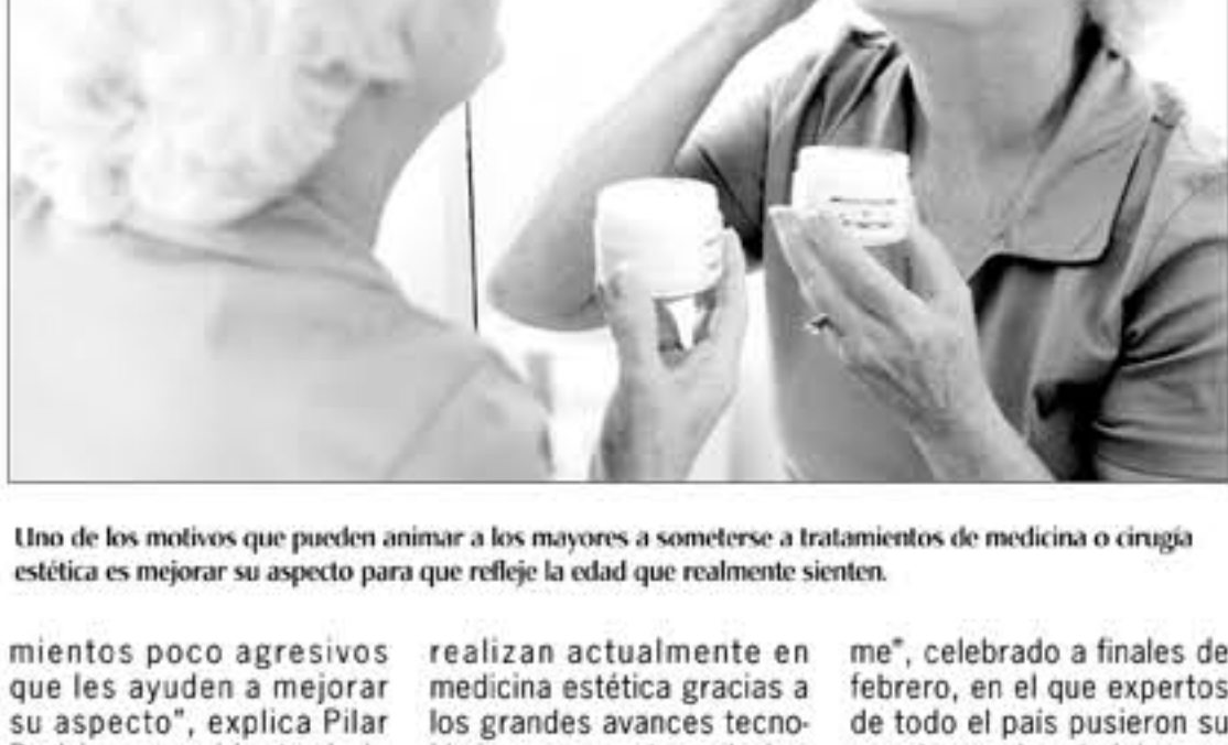
Uno de los motivos que pueden animar a los mayores a someterse a tratamientos de medicina o cirugía estética es mejorar su aspecto para que refleje la edad que realmente sienten.

"Ven que su edad física no se corresponde con su imagen y se sienten más jóvenes de lo que realmente aparentan, por lo que solicitan información sobre trata-