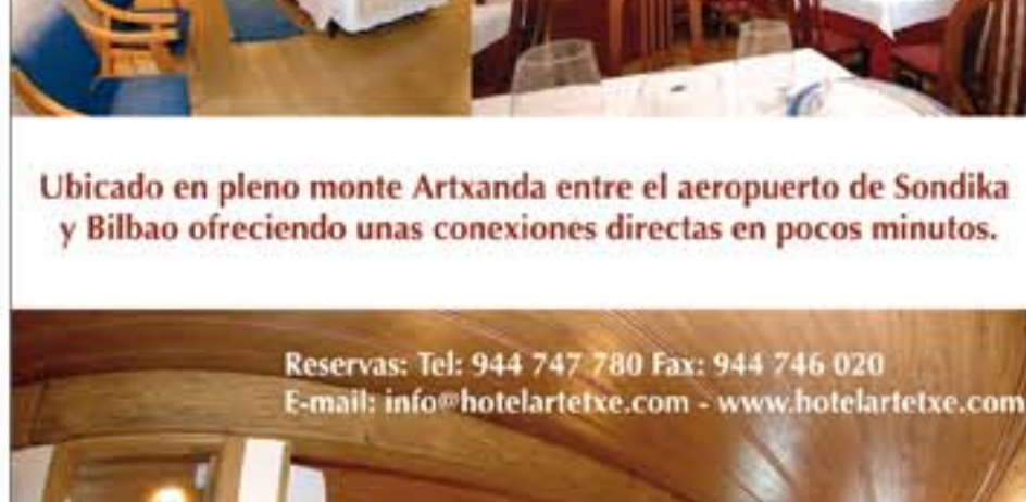
Ubicado en pleno monte Artxanda entre el aeropuerto de Sondika y Bilbao ofreciendo unas conexiones directas en pocos minutos.