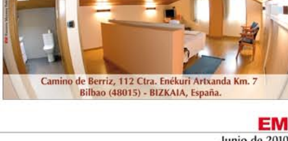
Reservas: Tel: 944 747 780 Fax: 944 746 020 E-mail: info@hotelartetxe.com - www.hotelartetxe.com