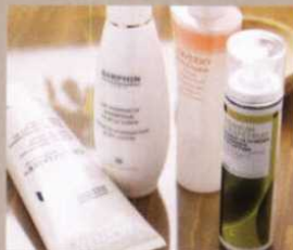
CELLULI LASER, BIOTHERM, 200 ML, 44€ BODY CREATOR, SHISEIDO, 200 ML, 40€ ACEITE DE GERANIUM & GRAPEFRUIT, KORRES, 100 ML, 19,70€ AROMATIC HYDROACTIVE, DARPHIN, 200 ML, 40€

LAS ESTRÍAS surgen cuando se rompen los tejidos de la piel debido a constantes cambios de peso. De ahí la importancia de prevenir su aparición con productos ultrahidratantes ricos en activos regenerantes, como el karité.